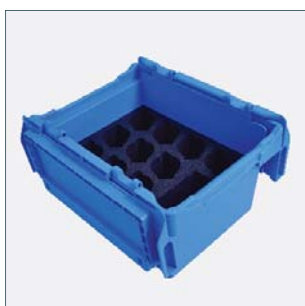
Cutie de transport cu spatiu pt 10 loggere SmartEAR și cu compartiment suplimentar Cod. 2014649