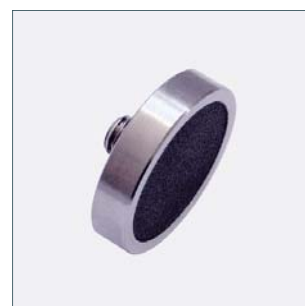
Adaptor magnetic (inclus automat cu fiecare logger SmartEAR) Cod. 820015167