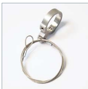
Asigurați cablu de sârmă cu inel de fixare a magnetului Cod. 2015049