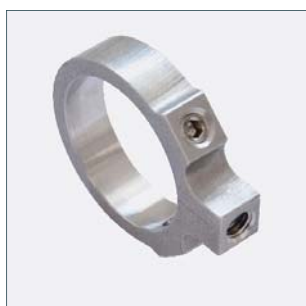
Inel de fixare a magnetului (reglabil gratuit la 360°) Cod. 2015069