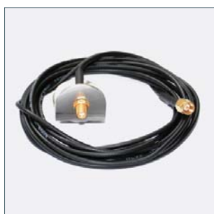
Extensie antenă (3m) Cod. 2011249