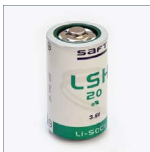
Baterie cu litiu SAFT Cod. 820007318