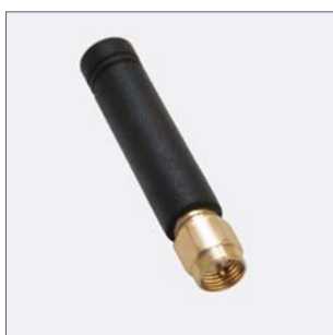
Antena extenă de mare putere Cod. 90035958